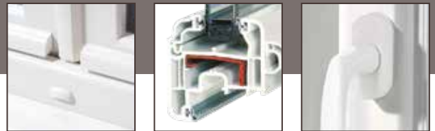
Qualité et finition dans les moindres détails